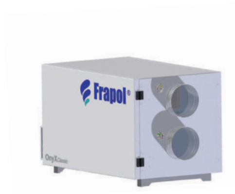
Onyx Classic 550

Kontroler urządzenia został zaprojektowany z myślą o zminimalizowaniu kosztów wentylacji (tryb automatyczny) oraz niezawodnym działaniu. Duży, czytelny wyświetlacz LCD oraz łatwość obsługi czyni go przyjaznym dla użytkownika, a zoptymalizowany algorytm sterowania i dynamiczny tryb wyświetlania, podnoszą poziom komfortu stosowania urządzenia.